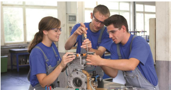
Arbeiten im Team ist eine wichtige Kompetenz in der heutigen Arbeitswelt.

Zusätzlich findet ein mehrwöchiges Berufspraktikum in Handwerks- oder Industriebetrieben statt. Dies ermöglicht nicht nur, erste Erfahrungen im zukünftigen Berufsfeld zu sammeln, sondern bietet darüber hinaus auch die Chance, sich in einem selbstgewählten Betrieb für die weitere Ausbildung zu qualifizieren.