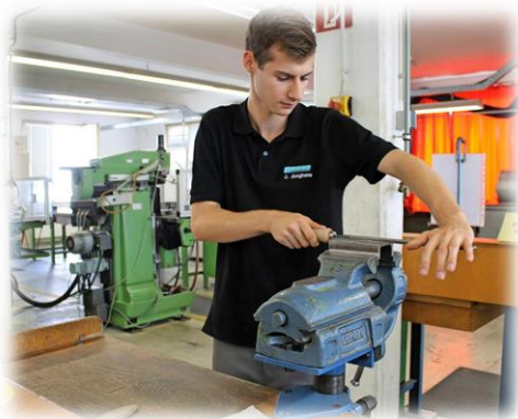
Auch das Fertigen von Hand wird gelernt