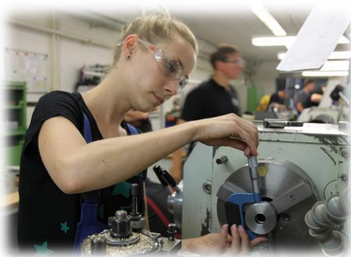
Drehen und Fräsen sind wichtige Fertigungsverfahren in der Industrie die in der 1BFM gelernt werden.

Bei erfolgreichem Besuch der 1BFM kann dieses Jahr als erstes Ausbildungsjahr angerechnet werden.