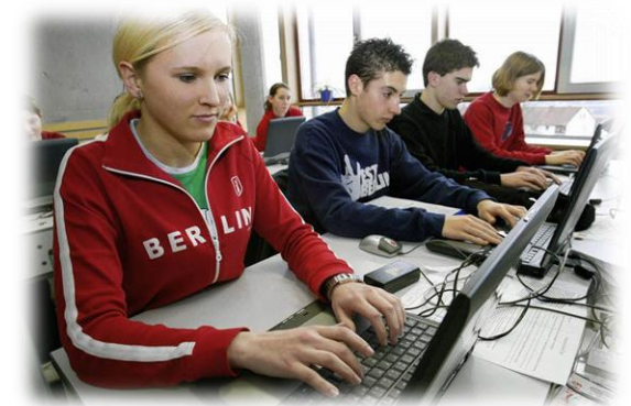
Auch Computerunterricht wird erteilt, in dem z.B. CAD-Modelle am PC erstellt werden.

Im fachpraktischen Bereich ist am Ende des Schuljahres eine praktische Abschlussprüfung abzulegen. Im Theoriebereich zählt die Jahresleistung für das Abschlusszeugnis.